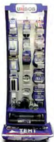
1600 мм x 500 мм 30 крючков, 2 съемные полки